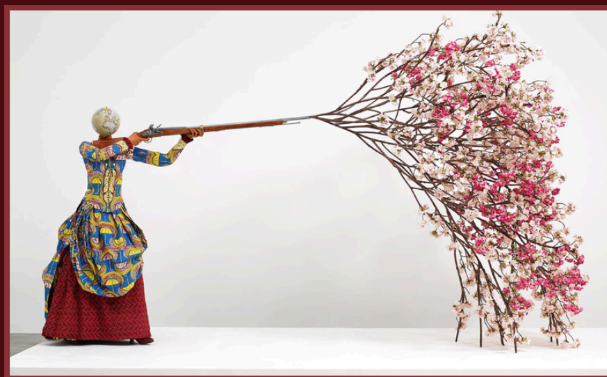
« Woman Shooting Cherry Blossoms » (Femme tirant sur un cerisier en fleur) par Yinka Shonibare, 2019.

Exploration des fractures narratives et esthétiques de la modernité à l'extrême contemporain